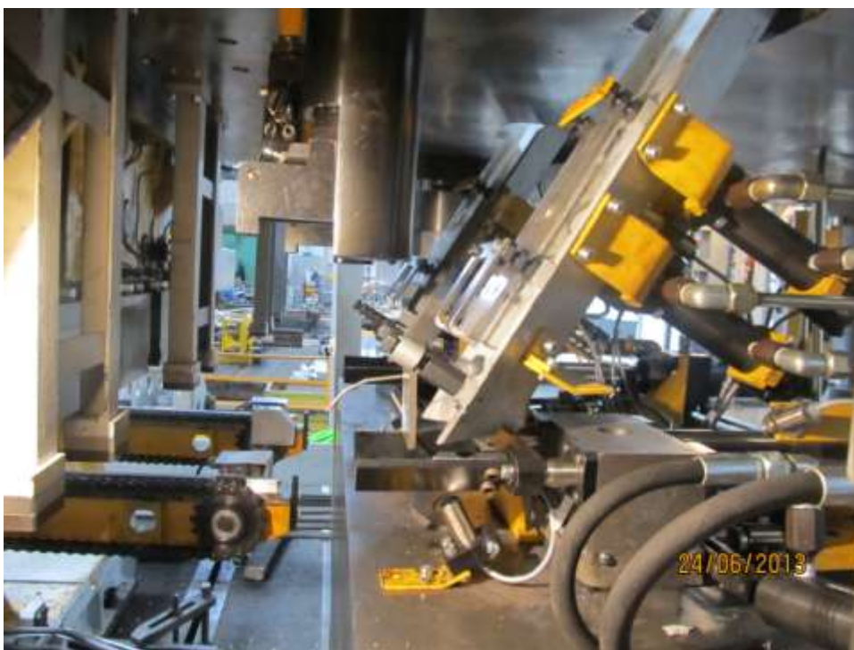
Вид обработанной штанги