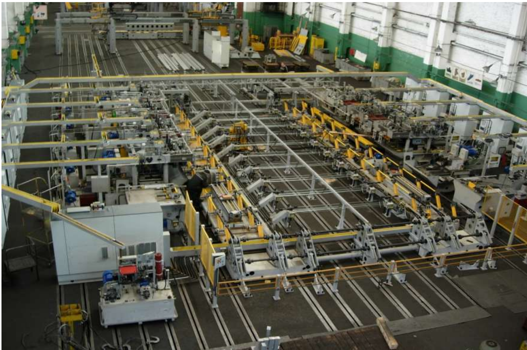
Общий вид линии ЛМ1591