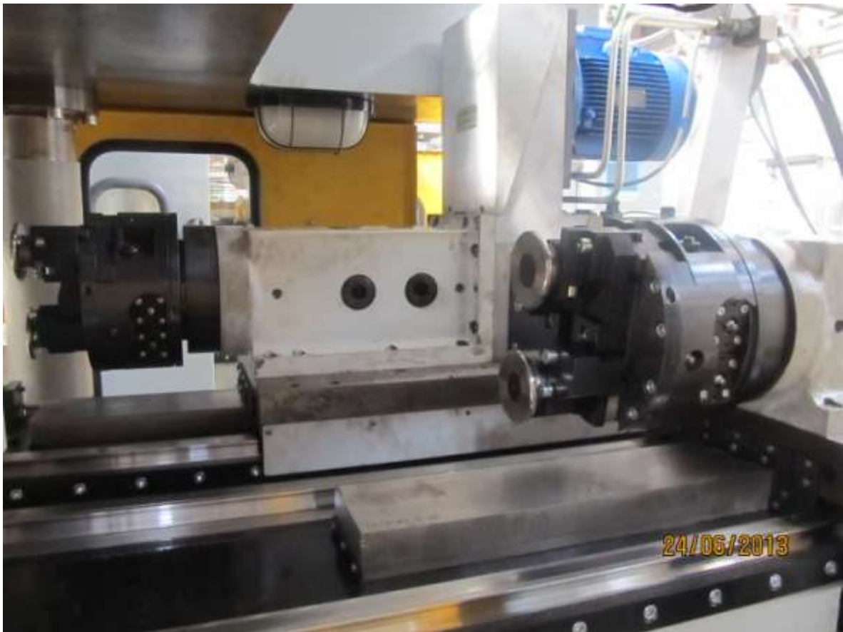
Операция 40- специальный резьбонакатной станок