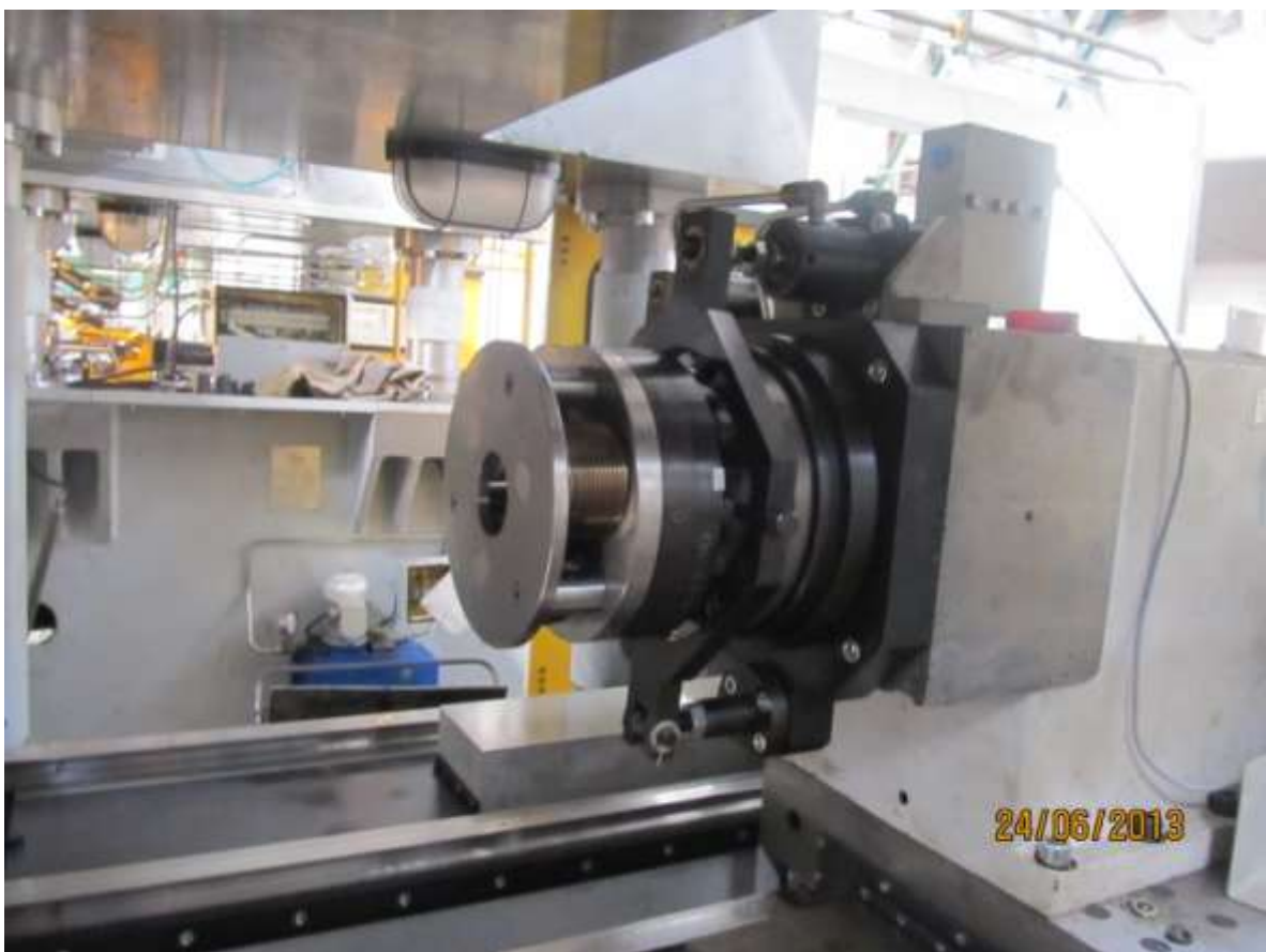
Операция 50 – Запрессовка защитных колпачков